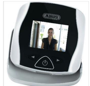
ABUS August Bremicker Söhne KG

Schalter und Steckdosen sind auf einer Höhe von 85 cm bis max. 1,05 m sinnvoll. Rollläden und Markisen sollten möglichst elektrisch bedienbar sein.